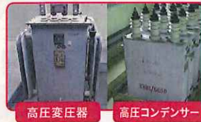
高圧変圧器 高圧コンデンサー