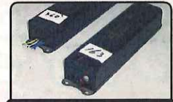
業務用・施設用蛍光灯の安定器