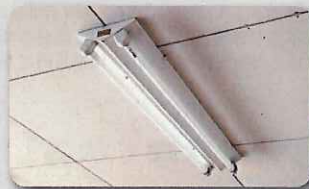
業務用・施設用蛍光灯の安定器